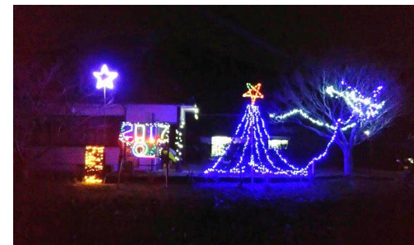
冬の風物詩；上和田清流会の「冬ホタル」