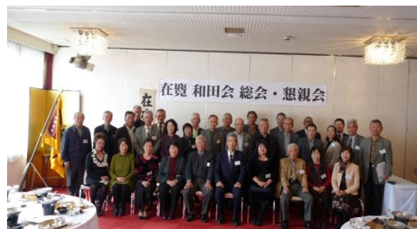
在鹿和田会総会・懇親会にて

29年度は、吹上砂丘荘で11月25日（土）に開催予定です。地区民の皆さんの参加をお願いします。