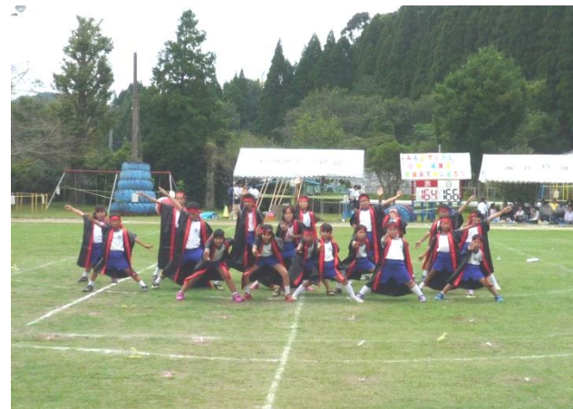
和田小児童のダンス「ロックソーラン」