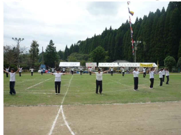
婦人部皆さんのマスゲーム「鹿児島パラダイス」