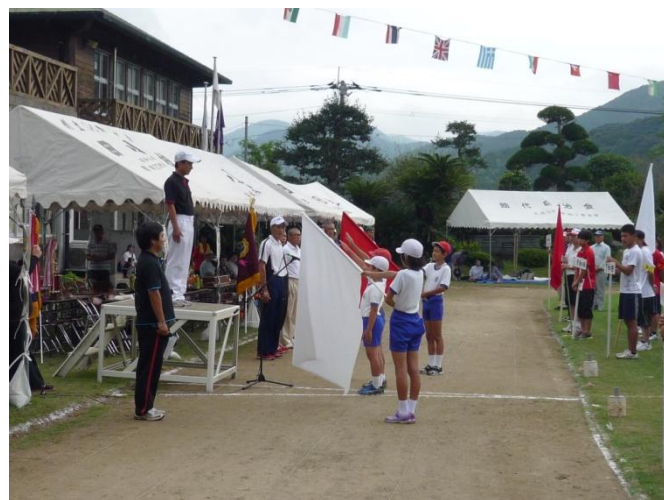
応援団旗を囲んで元気な選手宣誓

自治会対抗は、総合優勝 下和田自治会、第2位 助代自治会、第3位 中和田自治会でした。