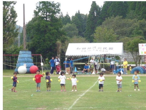
ゆうぎ「おひさまとダンス」