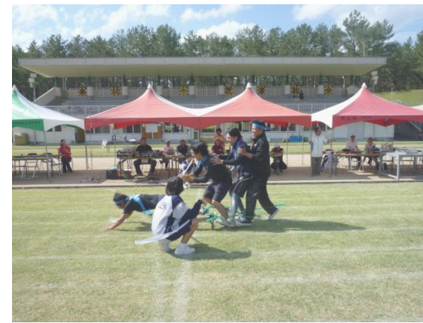
ムカデ競走：追い込み見事第2位