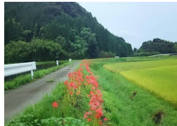
和田堀川農道沿いの彼岸花

この彼岸花ロードは、昭和 63 年頃、農村振興運動の一環として「美しい農村景観づくり」を目指して、圃場整備後の農道に球根の苗を植え、手入れし、育ててきたものです。今では、道路いっばいに咲きほこるようになりました。黄金色に色づく田んぼと、美しい和田の風物詩として大切に育てていきましょう。