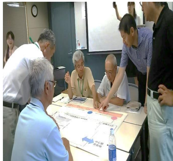
「1年に5人の転入者を」可能な数字だ！

和田地区にとっての働く場は、地区内にあればよいが、それがなくても鹿児島市内へは、車で 30 分から 40 分の距離にある。この地理的優位性をもっと生かすべきではないか。参加した 12 地区の中では、小学校もあり、和田地区は若者が定住する条件としては最も恵まれた地区であるということを再確認したところだ。