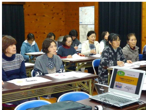
「いつまでも輝く女性に」学び続けましょう！

『やれることは自分でせんなら！！』精神で介護に頼らない自立した生活をいつまでも送りたいものです。