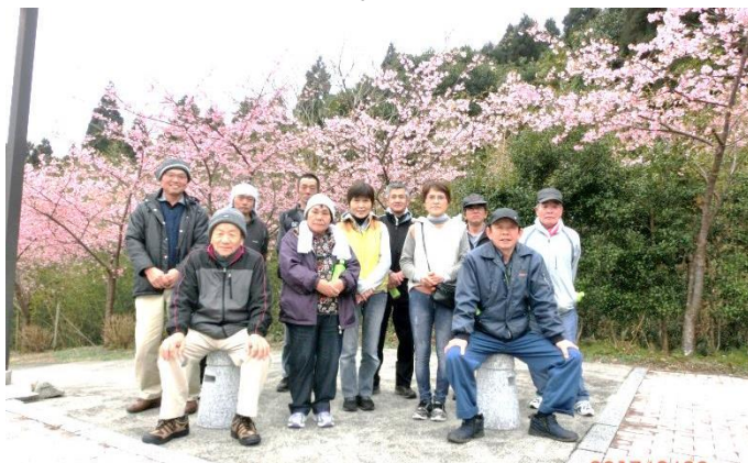
ヒカン桜をバックに記念撮影

歩こう会のあとは懇談会も開催され、和気あいあい、楽しい時間を過ごせました。同日に花壇の手入れも行い、綺麗な花が咲く春が待ち遠しいです。