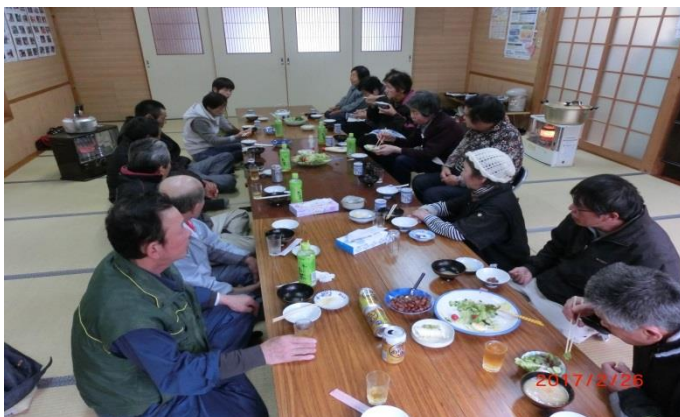
笠口の将来について語り合いました