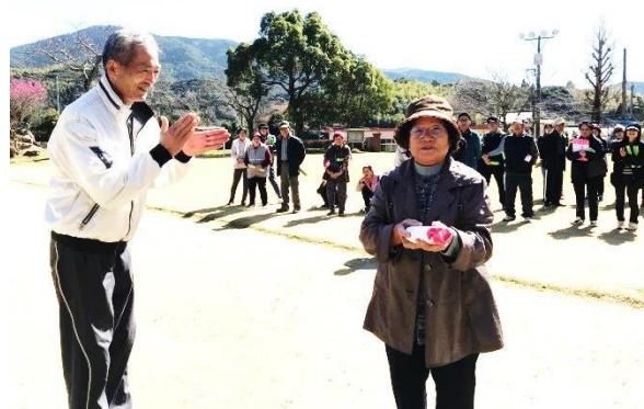
窪園さん『まさに元気に長生き』実践ですね！