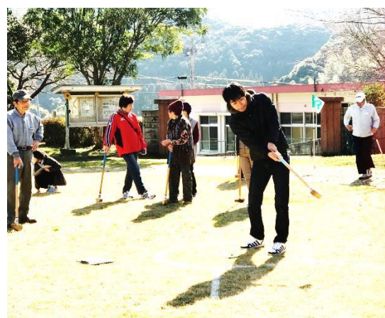
フォームも決まり、ナイスショット！！