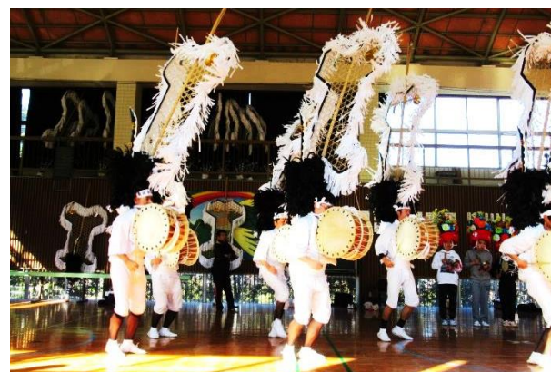
10 分間に短縮した構成で練習

和田保存会のみなさんが 2 月 25 日東京 NHK ホールで伊作太鼓踊りを披露します。その模様がテレビ放映されます。