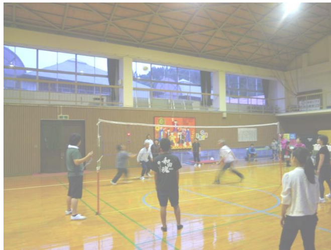
地区ソフトボール大会

成績は、優勝 上和田 A、準優勝 荳岡 B、3 位 中和田 B、4 位 荳岡 A でした。かねて運動不足がちな方も奮闘していたようです。これを機会に体にいいこと始めてみませんか。