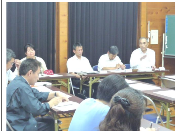
前期「心の教育」推進協議会

また、質疑の中で、 ものの豊かな時代に我慢すること、耐える力をつけるには、小学生の時から基本的な生活習慣 (早寝、早起き、あいさつなど) をきちんと身に付けることが大切である との言葉が印象深かったです。