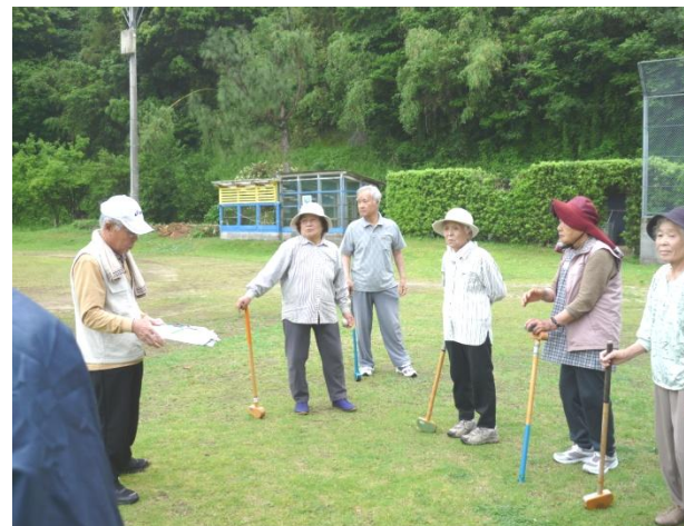
5月28日:小雨もなんのその、グランドゴルフを楽しみました。(和田小特設コートにて)

今年は34名でスタート。苜口、助代、上和田自治会はゼロです。おひとりでも参加できます。仲間の輪を広げましょう。