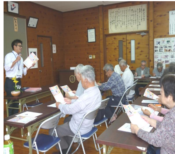
訪問販売:断る勇氣を 高かったなと思ったら、まず相談を!