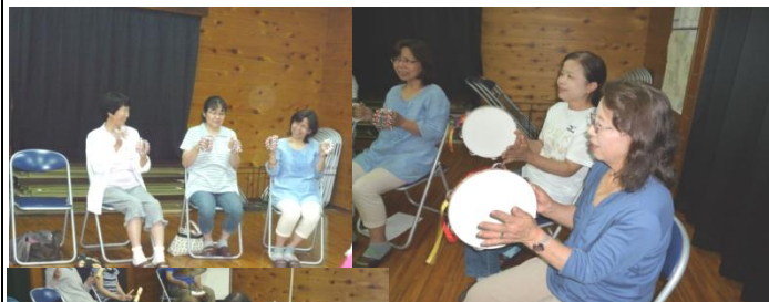
「音楽セッション」にチャレンジ! それぞれのパートにて みんなで合奏♪

第262号 平成28年6月24日発行 日置市吹上町和田地区公民館 電話 099-296-3031 ホームページ http://wada.jpn.org/