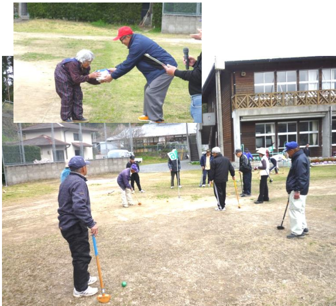
ホールインワン！珍プレーに歓声