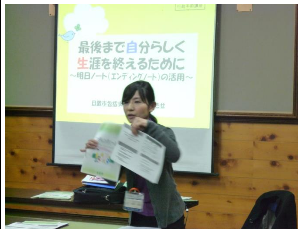
「エンディングノートで充実した人生を」