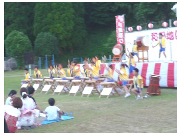
和田小児童のひまわり竹太鼓

ハッピー姿での多数の参加、などなどより楽しく、思い出に残る夏祭りとなりました。祭りの最後には、西酒造株式会社様協賛による花火が打ち上げられ、夏の夜空に大輪の花を咲かせ、おおいに彩りをそえて、盛り上がりました。