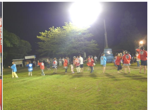
ハッピー、ゆかたで総踊り

今年も、出演者、青壮年部をはじめ地区の皆さんのご協力のおかげで、夏祭りを盛大に開催することができました。準備から後片付けまでありがとうございました。印象に残る、楽しい楽しい夏祭りでした。