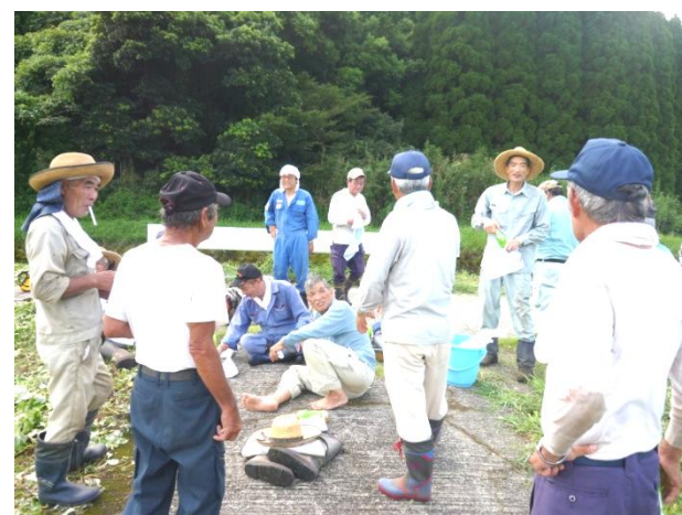
彼岸花の咲くのが楽しみ、ほっと一息

サポーター倶楽部では、会員募集中です。少しでも地域づくりの役に立ちたいと思う方、随時、加入は受け付けています。作業は自分の都合のつく時でよろしいです。なお、活動日は月1回程度、土曜日の午前中を予定しています。