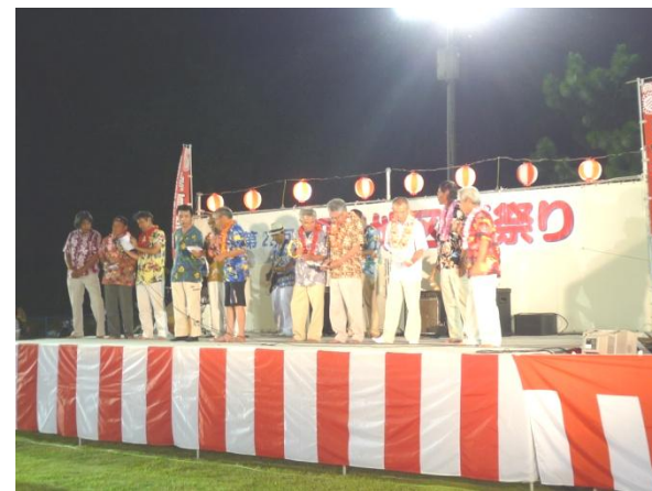
「おやじバンド」によるベンチャーズ曲集