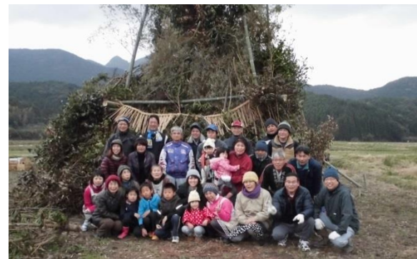
大きな櫓を前に下和田自治会のみなさん

1月8日・9日にかけて上和田・中和田・下和田自治会では鬼火焚きが開催されました。朝早くから、子ども会や青壮年部のみなさんが大きな櫓を組み鬼火焚きに向けて準備していただきました。婦人部の方々は、美味しいぜんざいを作り振る舞っていただき、寒い夜空の中、心も身体も温まりました。