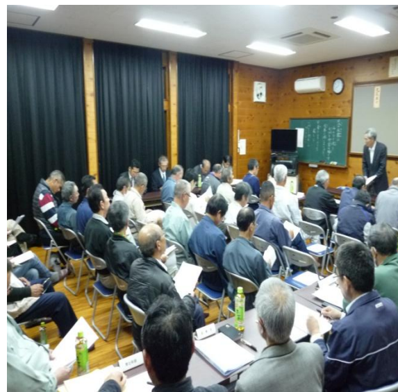
1年間の活動について熱心に協議