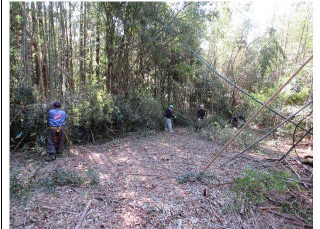
竹藪だった所がこんなに明るくなりました

竹藪の中を竹をかき分けながら入り、チェーンソーで竹を切っていく、広場を作りました。そして、どこから入るようになるかも検討しながら、竹藪の中を散策し、少しはいい案が出て来たように思えます。