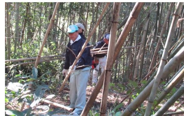
竹との戦い・・・(笑)

その準備として、3月10日にサポーター倶楽部会員有志の方々に頂上手前の竹藪の伐採作業を行いました。