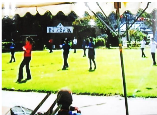
婦人部のマスゲーム“夢～KIBAIYANSE～”