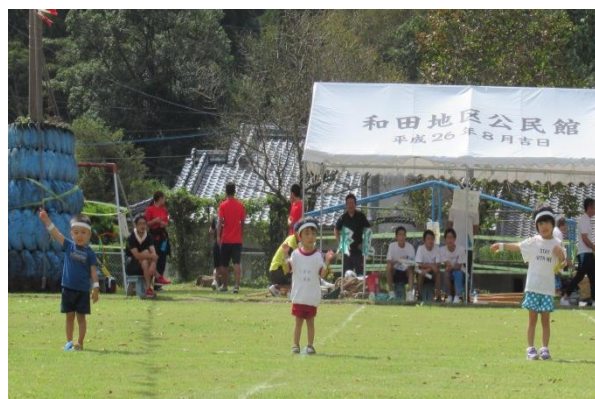
わだっ子のかわいいおゆうぎ「うー！★わっ！」