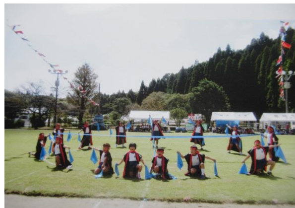
島津家の家紋「㊥」チェストー！