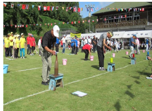
在薨和田会も参加「あわてず確実に」