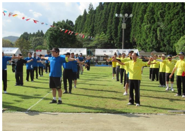
早朝からの準備をすませ、開会式！！