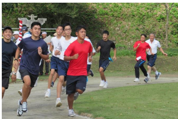
若いパワーが運動会を盛り上げます。