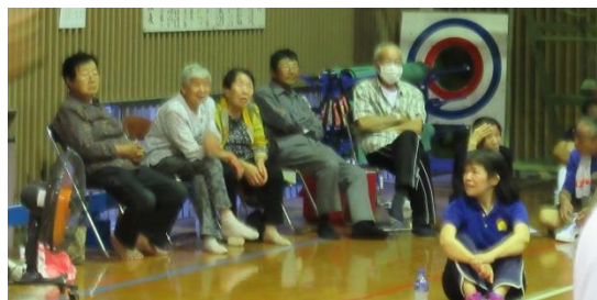
瀬谷自治会高齢部も応援で参加！「がんばれー」

試合に出場する方や応援で参加して下さる方、それぞれの役割で大会に参加、協力してくださいにぎやかに開催されました。