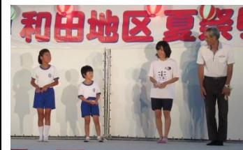
昨年の灯ろうコンクール受賞者です。

夏祭りは夏休みに帰省された方々との交流など地区民の親睦を深める大イベントです。みなさんお誘い合わせの上ご参加下さい。