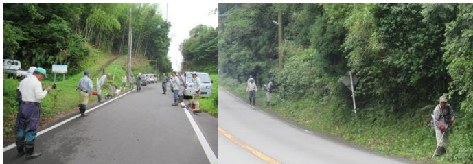
早朝より田中城跡、国道の草払いをしました。

今回の活動は、7月14日(日)瀬谷自治会の市道作業支援として市道庭坂線などの伐採作業を自治会の皆さんと一緒にいきます。