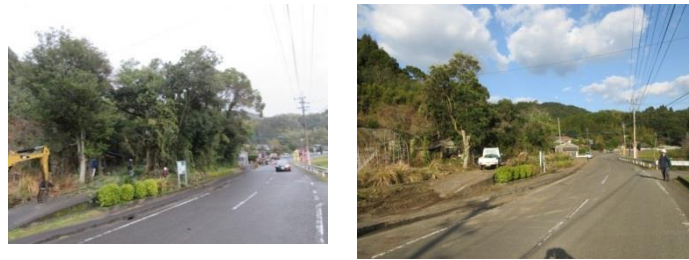
用水路・市道歩道に覆いかぶさった危険な大木除去、見通しも良くなりました（上和田公民館前市道沿い）

昨年からサポータ倶楽部員の協力のもと地区内の主要市道の支障木撤去にも取り組んでいます。今回は、上和田公民館前、用水路沿いの大木などの伐採。次回は、上和田から助代方面への市道和田平鹿倉線自歩道沿の支障木伐採を予定しています。