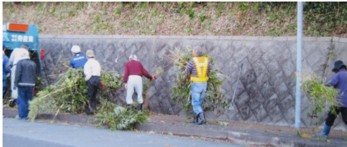
笠岡バス停付近がきれいになりました

笠岡自治会では、県のふるさとの道サポート事業も活用し年2回集落内国道の整備を行っています。