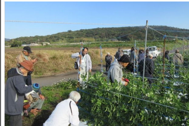
園芸教室、スナップエンドウの栽培視察 (山川町)