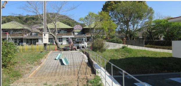
整備中の旧児童遊園地跡の出入口

成果①旧児童遊園地跡を整備 (手すり設置、出入口の生コン舗装) し遊休地の活用を図り不足する駐車場を確保できた。