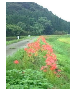
(堀川堤防の彼岸花ロード)

※活動費は、農地面積や管理・維持する施設などを考慮し配分してあります。前年度からの繰越分と今年度配分額の合計です。各自治会で有効に活用ください。