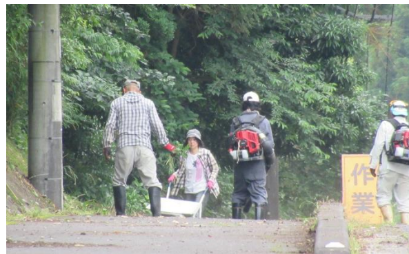
「日置市、南の玄関口」国道 270 号線をきれいに