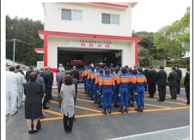
団員・協力会員 地域防災の拠点の完成を祝う