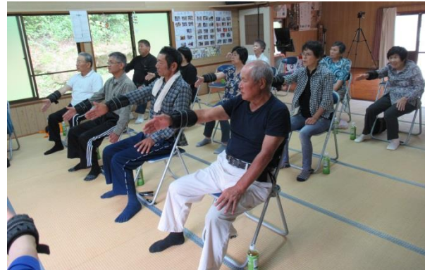
苜口自治会 筋ちゃん体操体験（R1. 6 実施）

目標は、全自治会での開催実現です。下和田・中和田・上和田につづき今年度より苜口自治会が開設しました。未開設の自治会では、PR 隊を呼んで是非、体験してみてください。少ない人数でも遠慮なく申し込みを！