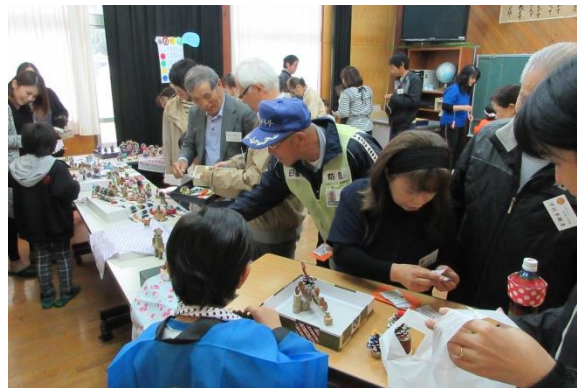
秋祭りで子どもたちと異世代交流！（R1 年度） 元気で長生き実現のために