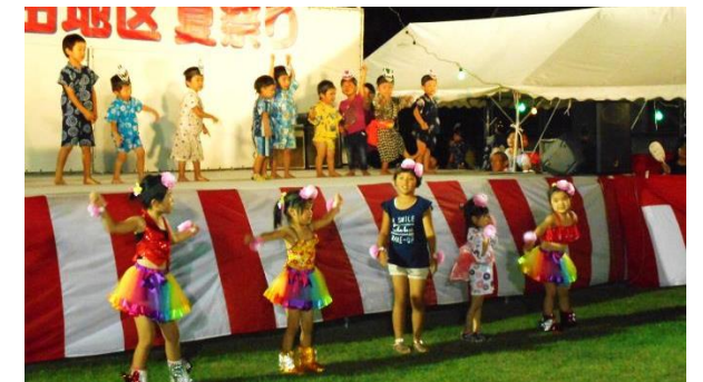
去年は、元気なわだっこの「パブリカ」、今年は何かな

祭りのフィナーレの花火大会は、打ち上げ花火を主にし、和田の夏の夜空をかざってもらいます。