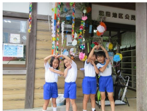
児童クラブの元気な子どもたちが作成

7 月 は、地区公民館はじめ各自治公民館の玄関を七夕飾りが彩りました。「コロナが早くおさまりますように！」という願いが多かったです。