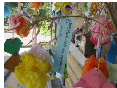
みんなの願いが届きますように！