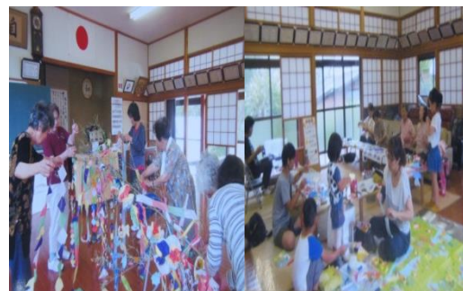
上和田自治会(子ども育成会も一緒に作りました)