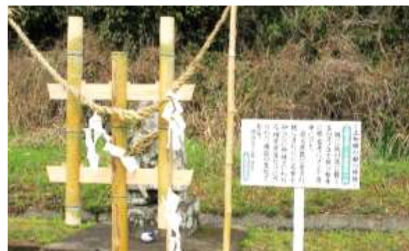
説明看板があるとわかりやすい・・・