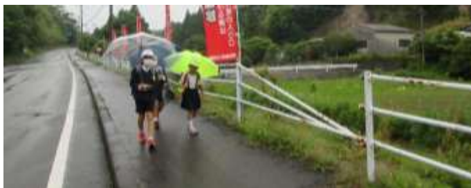
通学路の安全確保を、ガードパイプ改修