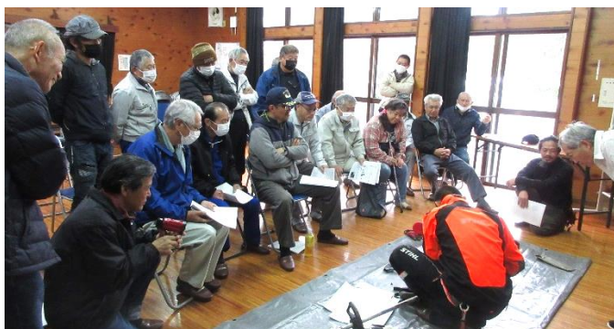
機械を正しく手入れすることで事故防止につながります

1 月 21 日（日）和田水土里クラブと地区公民館産業部により、刈払機・チェーンソーの取扱い講習会を開催しました。