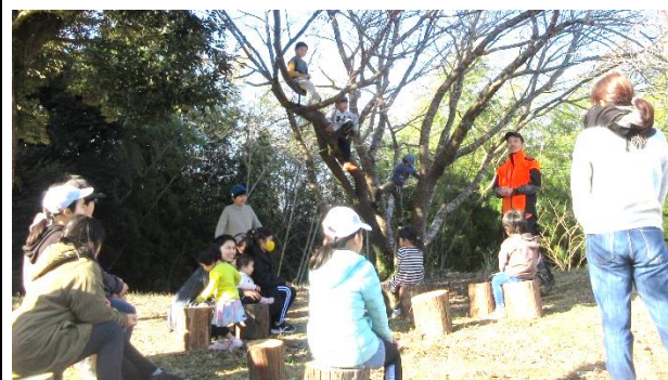
切り株や木の上で聞き入るのは、山の神様のお話