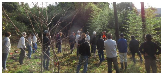
実技：田中城跡にて 10 メートル超の杉木を伐採

講義の時間では、実際の機械を使って日常的な点検及び手入れ方法の解説を実施。参加者の皆さんは熱心に聞き入り、積極的に質問が交わされ、意識の高さが伺われました。日頃使用することの多い刈払機ですが、正しいメンテナンス方法を知らないまま使っている人も多いのではないのでしょうか。機械の不備は大きな事故につながります。日頃からこまめな点検・整備に努めましょう。