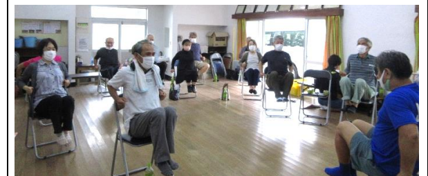
令和5年7月開催 苜岡健康セミナー