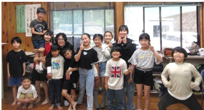
いつまでも子どもたちの声が聞こえる地域を(児童クラブ)

この理想の地区の姿に向かって、地区民の「理解と協力」「共生・協働」により地域課題解決に向けて、積極的に取り組み和田地区の目指す地域像「持続可能な地域」実現に向けて行動します。