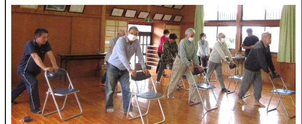
令和5年10月開催 中和田健康セミナー

昨年まで各自治会で開催していた健康セミナーを、令和6年度は「地区健康まつり」として地区で開催することになりました。3年間の健康セミナーの成果を今後も継続し、生活の中に運動習慣を身に付け元気で長生きできる体作りを目指します。