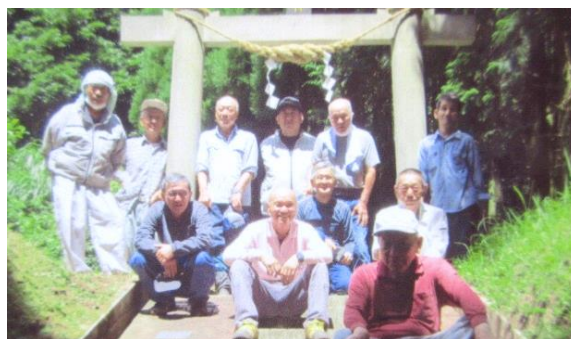
農村文化の伝承「苧神様」祭り(苧口)

水土里クラブ活動(多面的機能支払い交付金)は、農業・農村の多面的機能の維持発展のためにその地域に住む人、地域を愛する人たちの共同活動を支援する国の制度です。